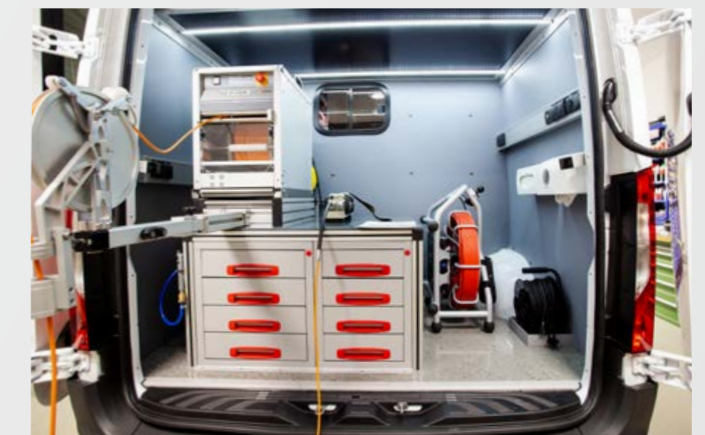
Quereinbau mit 300m Hauptkanalanlage und Schiebeanlage