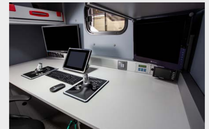
Quereinbau mit DCX5000