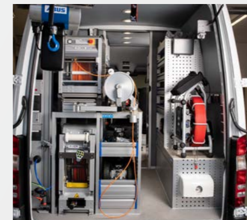
Längseinbau mit 500m Hauptkanal-, SAT-Anlage und Schiebeanlage