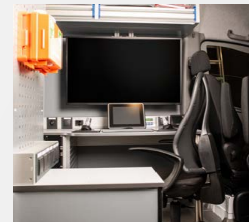
Längseinbau mit DCX5000